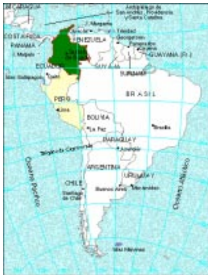
Colombia in South America